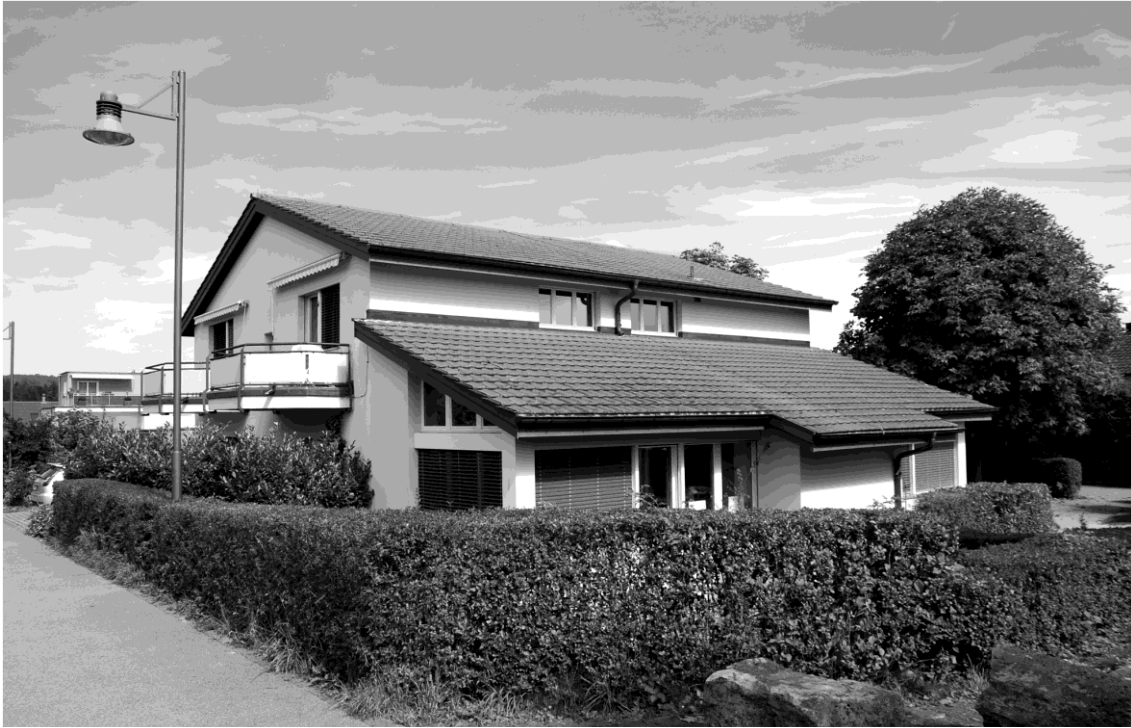
Bild oben: Der Breitacher-Chindsgi, dem das vorstehende Lied gewidmet ist. Heute ist darin eine Spielgruppe untergebracht.

Bild unten: Rechts aussen die erste Linde im Buswendeplatz – die zum nachfolgenden Lied inspiriert hat – bei einer der ersten Postautofahrten zwischen Mellinger-Heitersberg und Brugg. Anfänglich fuhren auch die Postautos die Haltestelle im Haberacher an. Später wurde aus fahrplantechnischen Gründen auf die Zusatzschleife bei dieser Strecke verzichtet.