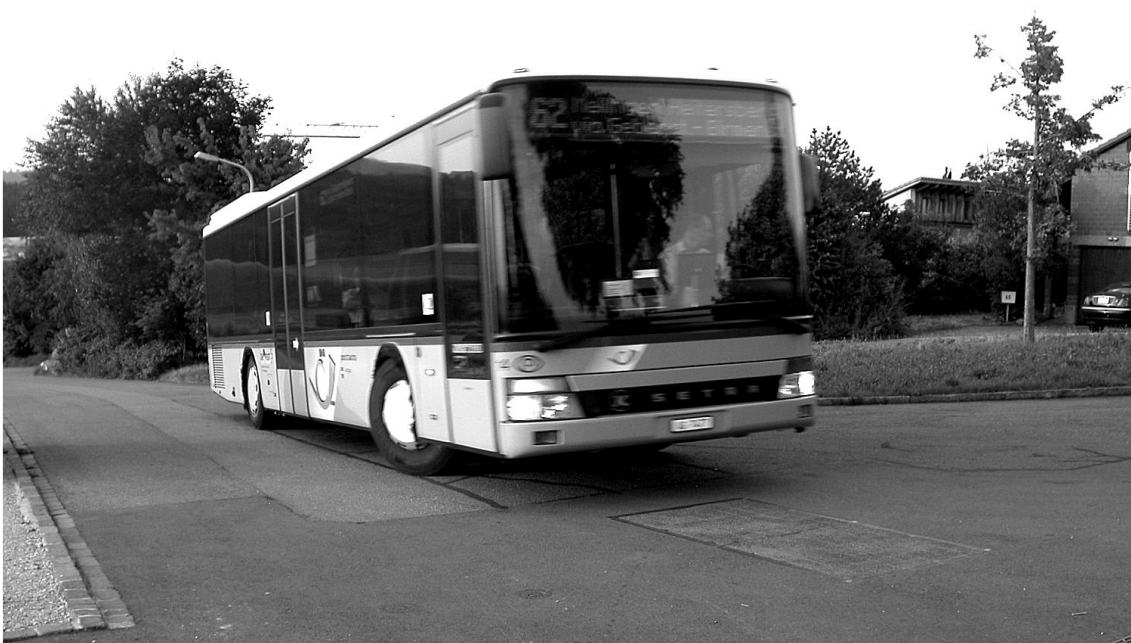
Bild unten: Rechts aussen die erste Linde im Buswendeplatz – die zum nachfolgenden Lied inspiriert hat – bei einer der ersten Postautofahrten zwischen Mellinger-Heitersberg und Brugg. Anfänglich fuhren auch die Postautos die Haltestelle im Haberacher an. Später wurde aus fahrplantechnischen Gründen auf die Zusatzschleife bei dieser Strecke verzichtet.

Bild oben: Der Breitacher-Chindsgi, dem das vorstehende Lied gewidmet ist. Heute ist darin eine Spielgruppe untergebracht.